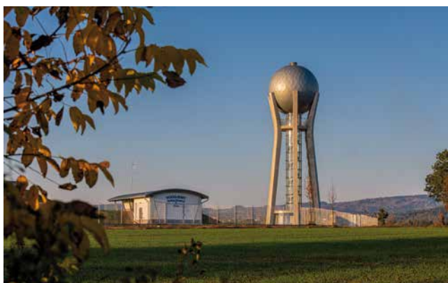
Vodojem Ohrazenice u Turnova

Stavíme prospěšné stavby, šetrné k přírodě, užitečné pro lidi a krásné na pohled.