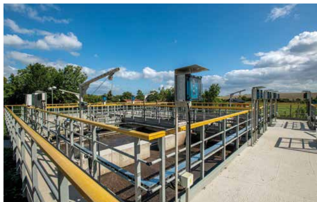
Čistírna odpadních vod Čížkovice

Stavíme prospěšné stavby, šetrné k přírodě, užitečné pro lidi a krásné na pohled.