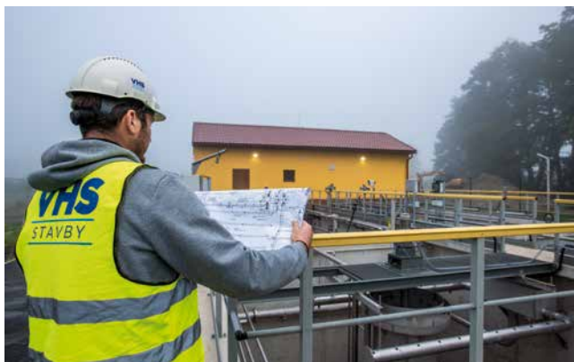
Čistírna odpadní vod Příšovice

V čištění odpadních vod patříme k nejlepším.