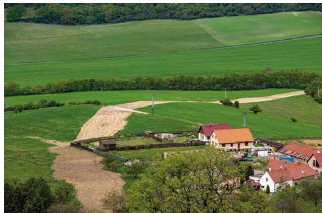
Vodovodní přívaděč Michalovice - Libochovany, 2020

V čištění odpadních vod patříme k nejlepším.