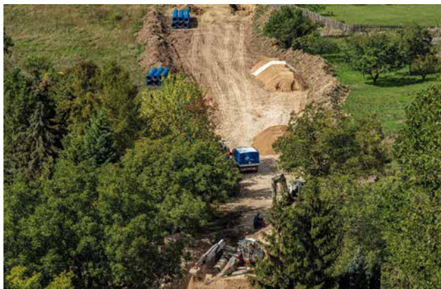
Vodovodní přívaděč Michalovice - Libochovany, 2019

Naše projekty mnohdy nejsou na první pohled vidět, ale bez nich by nebyl život.