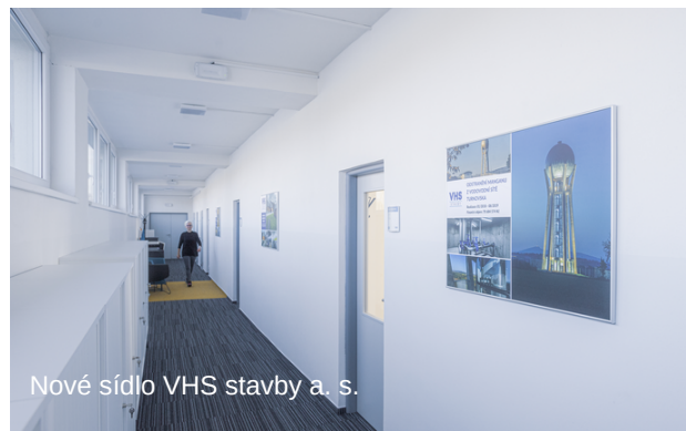
Nové sídlo VHS stavby a. s.

Zásadní a pro celý v Liberci se rozrůstající tým velmi příjemnou změnou v letošním roce je nové moderní a prostorné sídlo naší společnosti. Za pomocnou ruku a interiérové řešení děkujeme regionální firmě Bacovský Interiéry.