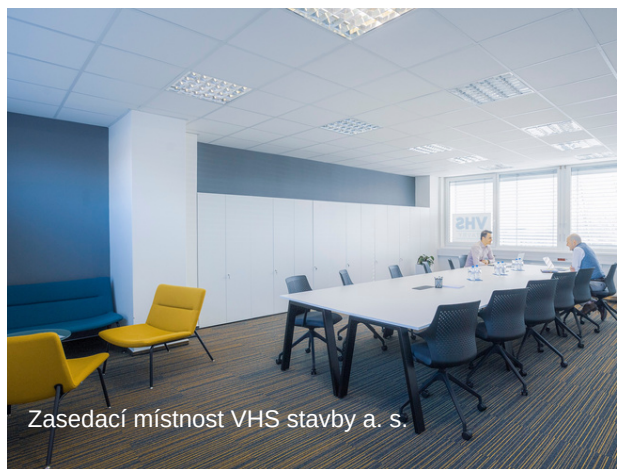
Zasedací místnost VHS stavby a. s.

Nyní nás najdete v Liberci, v Bánskobystrické ulici v areálu GALL. Jen kousek od rychlostní komunikace směrem na Ještěd.